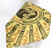
Gorgonzola Dolce 1/8